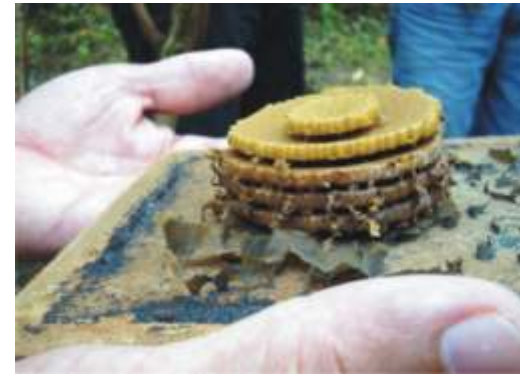
Disco de cria de jataí Tetragonisca angustula