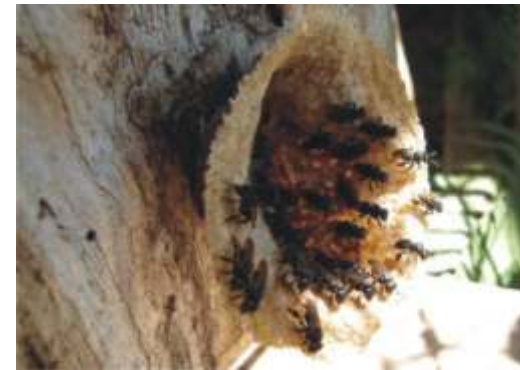
Ninho de tubuna Scaptotrigona bipunctata