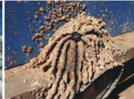
Ninho de mandaçaí Melipona quadrifaciata